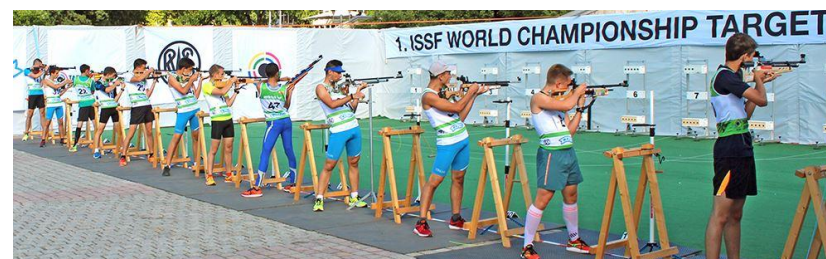
Abbildung 2, https://www.swissshooting.ch/de/schiesssport/ausbildung-richter/targetsprint/

Anmeldung: info@targetsprint.ch www.targetsprint.ch