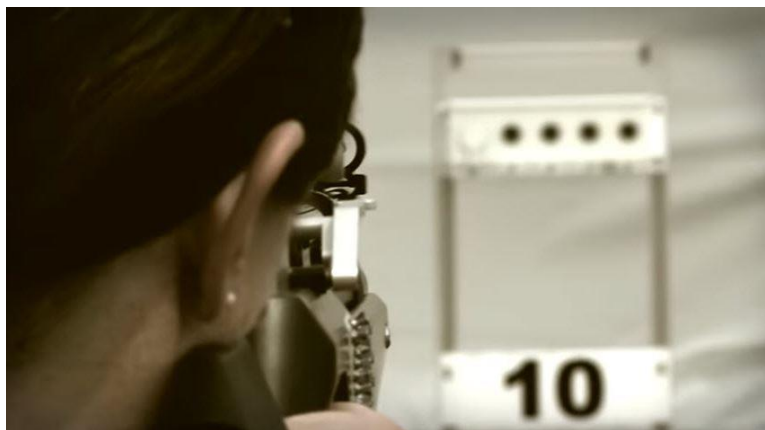
Abbildung 1, https://www.swissshooting.ch/de/schiesssport/ausbildung-richter/targetsprint/

Der Schweizer Schiesssportverband lanciert mit dem TargetSprint eine neue ISSF Disziplin, eine spannende Kombination von schnellem Luftgewehrschiessen unter körperlicher Belastung und Mitteldistanz Laufwettbewerb. TargetSprint. Teilnehmende sind in Wettkampfdurchgängen und einer vorgegebenen Laufstrecke von jeweils 400m zugewiesen.